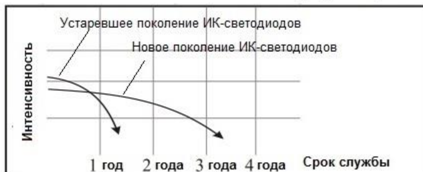
График зависимости интенсивности свечения ИК-светодиодов от срока эксплуатации